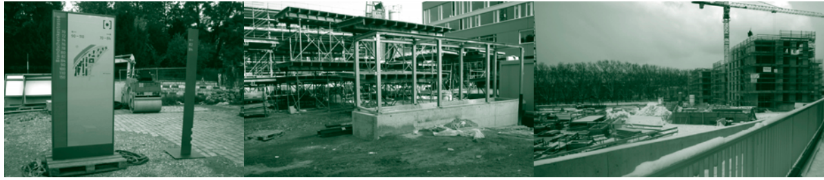
Etappen im Um- und Neubau des Hürlimann Areals in Zürich-Enge